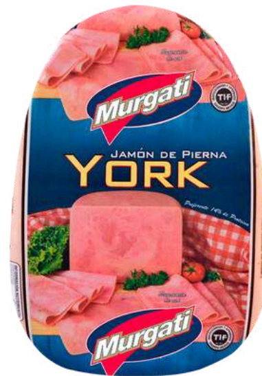
Jamón de pierna york. Presentación: Mandolina. Clave: MG1103.