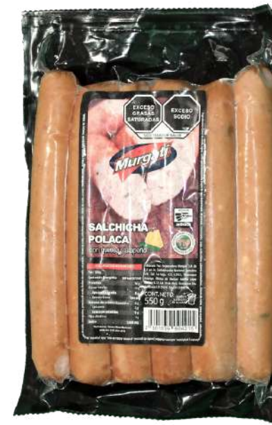
Salchicha polaca queso y jalapeño. Presentación: Paquete 550 gr (6 piezas). Clave: MG2138.