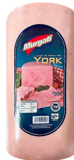
Jamón de pierna york. Presentación: Cojín. Clave: MG1104.