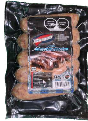
Chorizo argentino. Presentación: Paquete 550 gr (5 piezas). Clave: MG3108.