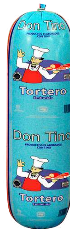
Tortero. Presentación: Misil. Clave: DT1517.