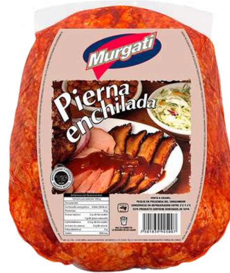
Pierna cerdo enchilada. Presentación: Bolsa (1 pieza). Clave: MG5104.