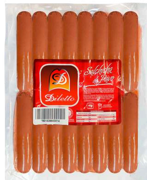
Salchicha de pavo - pre. Jumbo. Presentación: Paquete 4 kg (granel). Clave: DL4100.*