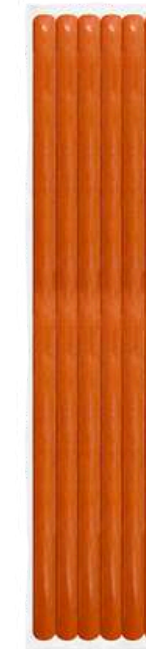
Salchicha de pavo ahumada extra 50 cm. Presentación: Paquete (6 piezas). Clave: DL4103.