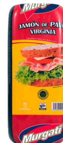
Jamón virginia de pavo. Presentación: Cuadro 11x11. Clave: MG1301.