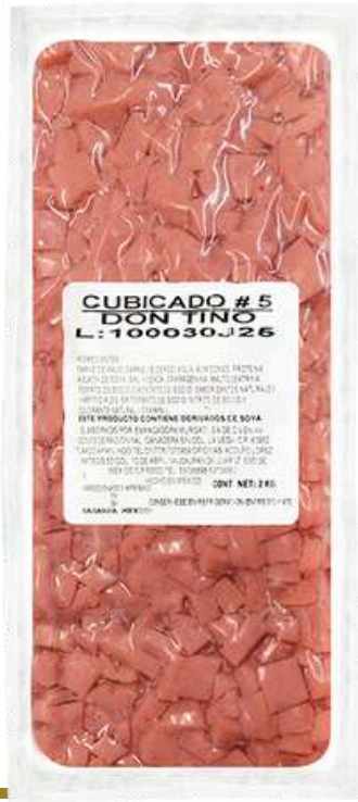
Cubicado no.5. Presentación: Paquete 2.0 kg cubicado. Clave: DT1516.