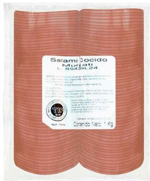
Salami cocido. Presentación: Paquete 1.0 kg misil. Clave: MG2101.