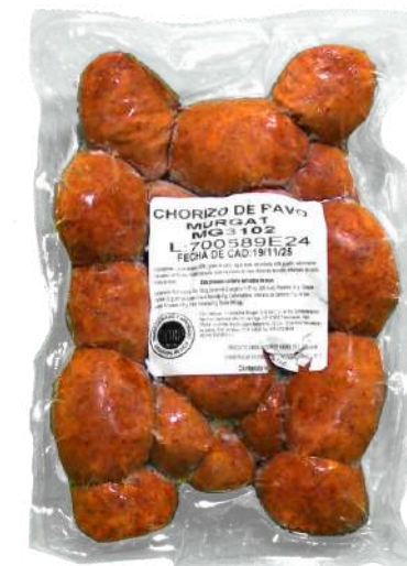
Chorizo de pavo. Presentación: Paquete 500 gr. Clave: MG3102.