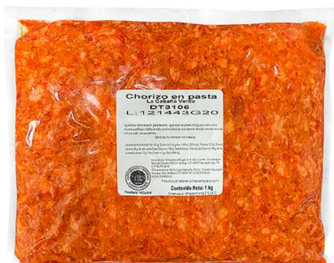
Chorizo en pasta. Presentación: Paquete 1.0 kg. Clave: DT3106.