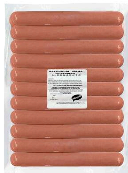
Salchicha viena - pre. Jumbo. Presentación: Paquete 2 kg (granel). Clave: DL4102.*