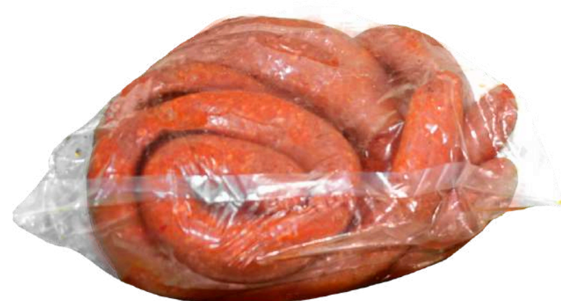
Longaniza taquera. Presentación: Bolsa (granel). Clave: DT3104.