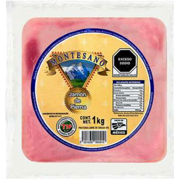
Jamón de pierna rebanado Montesano. Presentación: Paquete 1.0 kg. Cuadro clave: MT1100.