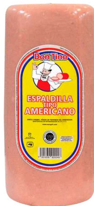
Espaldilla tipo americano. Presentación: Rombo. Clave: DT1510.