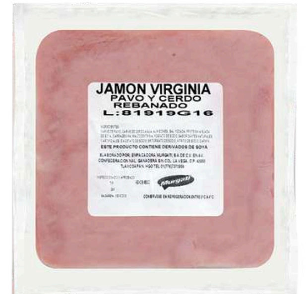
Jamón Virginia de pavo- cerdo. Presentación: Paquete 1.0 kg cuadro. Clave: MG1529.