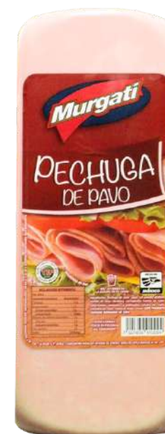
Pechuga de pavo. Presentación: Cuadro 11x11. Clave: MG1319.