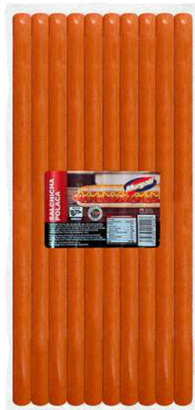
Salchicha Polaca 50 cm. Presentación: Paquete 1.5 kg (6 piezas). Clave: MG2136.