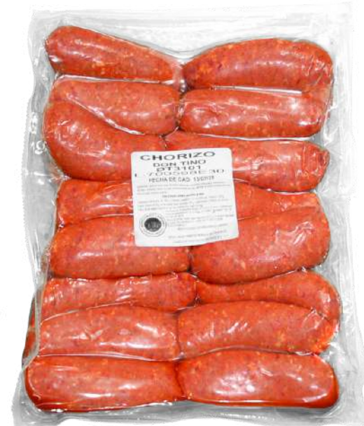
Chorizo. Presentación: Paquete 2.2 kg (granel). Clave: DT3101.