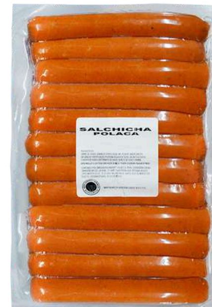
Salchicha polaca 18cm. Presentación: Paquete 4 kg (granel). Clave: MG2111.