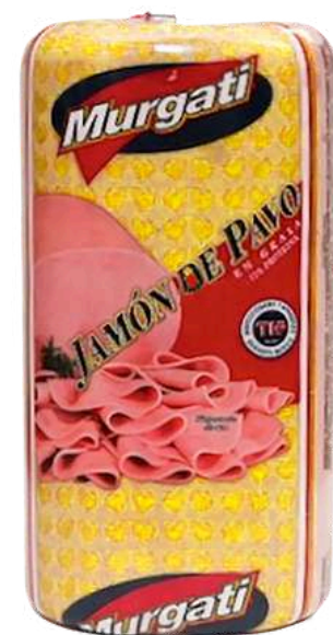
Jamón de pavo. Presentación: Ovalado. Clave: MG1302.