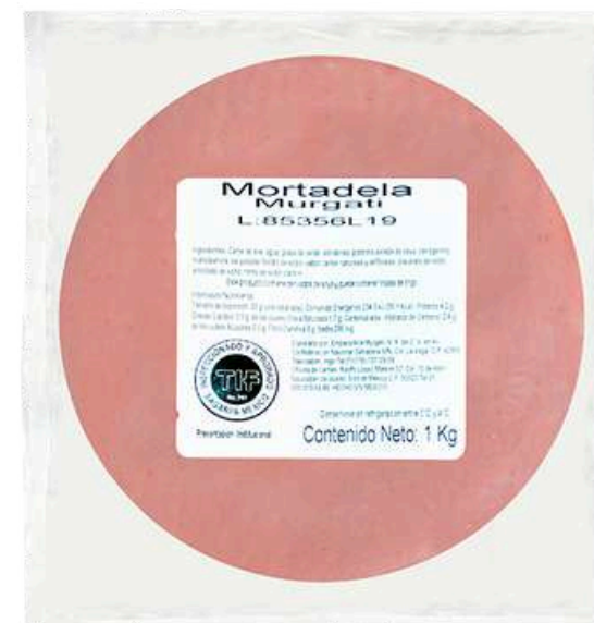
Mortadela. Presentación: Paquete 1.0 kg misil. Clave: MG4101.