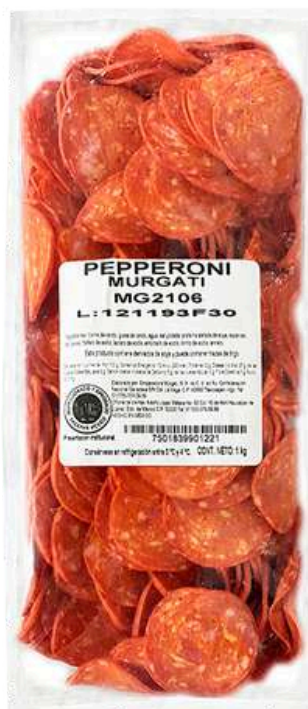
Pepperoni. Presentación: Paquete 1.0 kg redondo. Clave: MG2106.