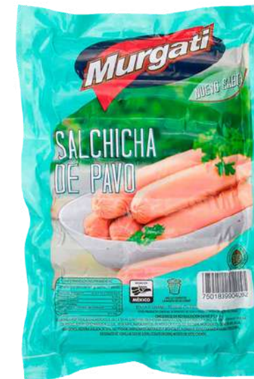
Salchicha de pavo premium. Paquete 2.3 kg (granel). Clave: MG4123.