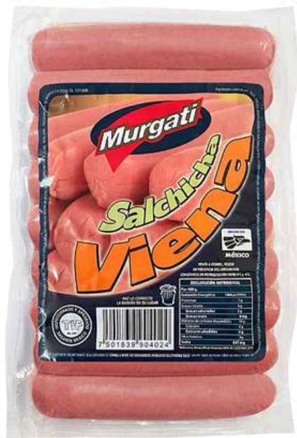
Salchicha Viena. Presentación: Paquete 1 kg (granel). Clave: MG4130.