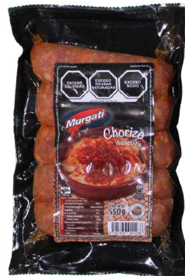
Chorizo yecapixtla. Presentación: Paquete 550 gr (5 piezas). Clave: MG3107.