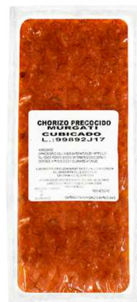
Chorizo cubicado pre- cocido. Presentación: Paquete 2.0 kg cubicado. Clave: MG2103.*