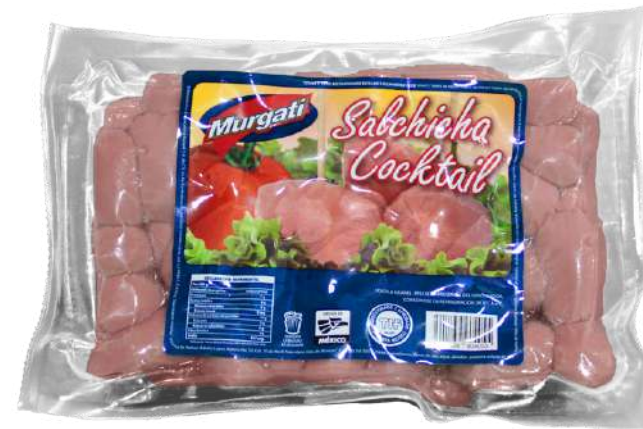
Salchicha cocktail. Presentación: Paquete 1.8 kg (granel). Clave: MG4105.