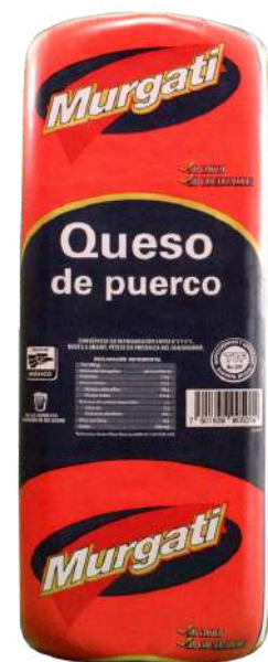
Queso de puerco. Presentación: Cuadro. Clave: MG2108.