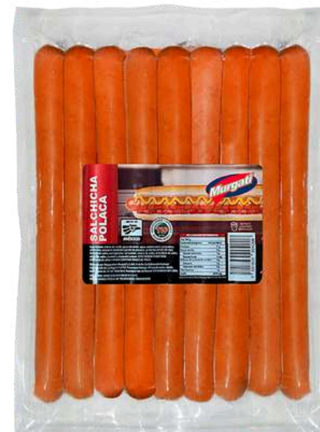
Salchicha Polaca 27 cm. Presentación: Paquete 2.16 kg (16 piezas). Clave: MG2114.