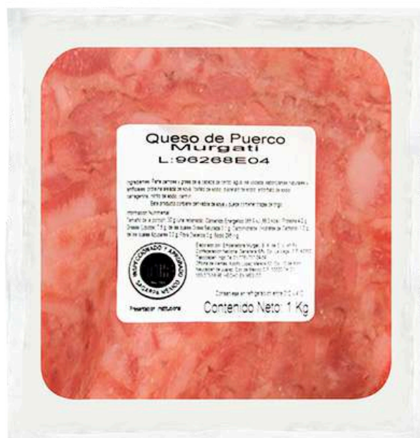
Queso de puerco. Presentación: Paquete 1.0 kg cuadro. Clave: MG2109.