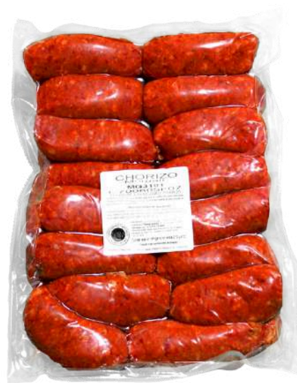
Chorizo de cerdo. Presentación: Paquete 2.2 kg. Clave: MG3101.