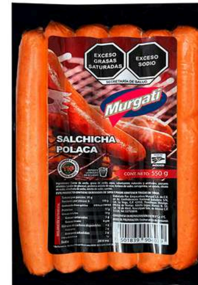
Salchicha polaca. 18cm. Presentación: Paquete 550 gr (6 piezas). Clave: MG2112.