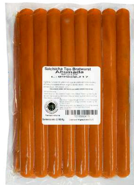
Salchicha tipo bratwurst ahumada. Presentación: Paquete 2.16 kg (16 piezas). Clave: MG2129.*