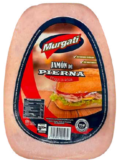
Jamón de pierna. Presentación: Mandolina. Clave: MG1115.