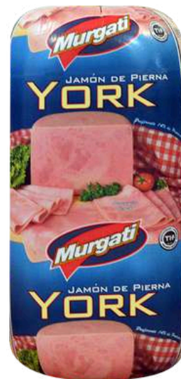
Jamón de pierna york. Presentación: Cojín. Clave: MG1104.