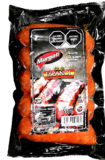
Chorizo español. Presentación: Paquete 550 gr (5 piezas). Clave: MG3109.