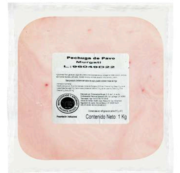
Pechuga de pavo mg. Presentación: Paquete 1.0 kg cuadro 11x11. Clave: MG1322.