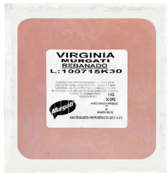
Jamón Virginia. Presentación: Paquete 1.0 kg cuadro. Clave: MG1525.