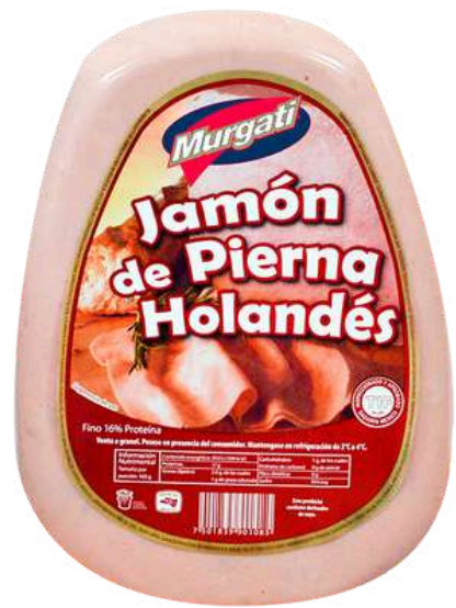
Jamón de pierna holandés. Presentación: Mandolina. Clave: MG1102.