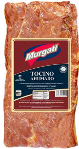
Tocino ahumado. Presentación: Bolsa (1 penca). Clave: MG5100.