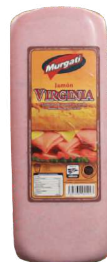
Jamón virginia pavo y cerdo. Presentación: Cuadro 11x11. Clave: MG1509.