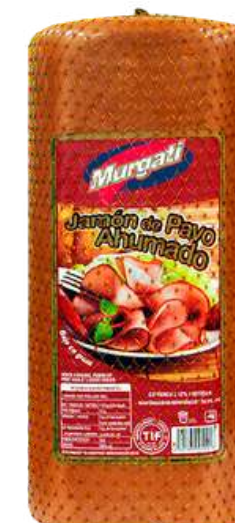
Jamón de pavo ahumado. Presentación: Rombo. Clave: MG1304.