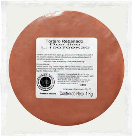
Tortero rebanado. Presentación: Paquete 1.0 kg misil. Clave: DT1518.