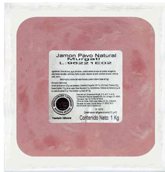
Jamón de pavo natural. Presentación: Paquete 1.0 kg cuadro 11x11. Clave: MG1312.