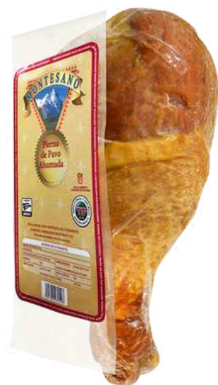
Pierna de pavo ahumada. Presentación: Paquete (1 pieza). Clave: MT5103.*