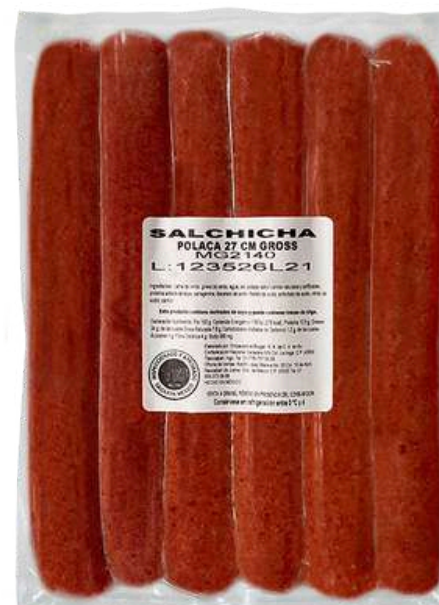
Salchicha polaca gross. Presentación: Paquete 260 gr. Clave: MG2140.*