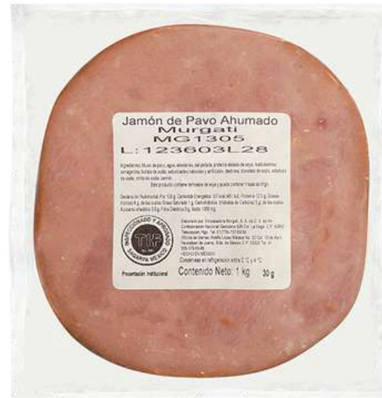
Jamón pavo ahumado. Presentación: Paquete 1.0 kg rombo. Clave: MG1305.