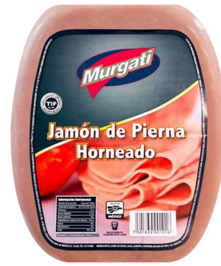
Jamón de pierna horneado. Presentación: Mandolina. Clave: MG1100.