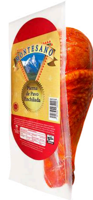
Pierna de pavo enchilada. Presentación: Paquete (1 pieza). Clave: MT1305.*