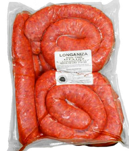
Longaniza. Presentación: Paquete 2.2 kg (granel). Clave: DT3102.