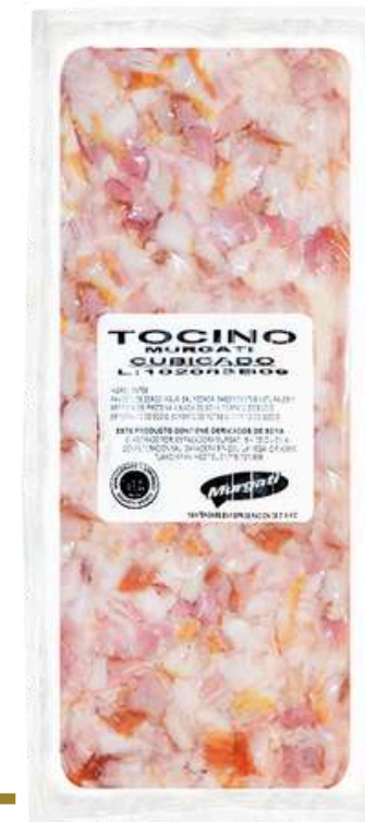
Tocino ahumado cubicado. Presentación: Paquete 2.0 kg cubicado. Clave: MG5103.