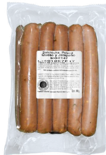
Salchicha polaca queso y jalapeño. Presentación: Paquete 950gr (10 piezas granel). Clave: MG2147.