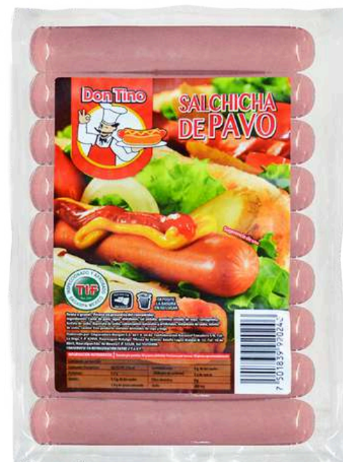
Salchicha de pavo. Presentación: Paquete 2.3 kg (granel). Clave: DT4107.