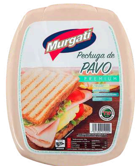
Pechuga de pavo premium. Presentación: Mandolina. Clave: MG1323.