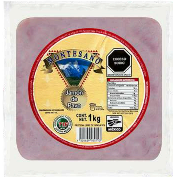
Jamón de pavo rebanado Montesano. Presentación: Paquete 1.0 kg. Cuadro. Clave: MT1302.