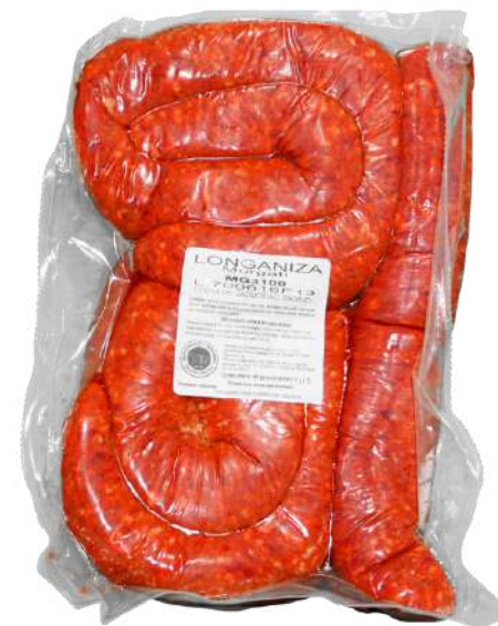
Longaniza de cerdo. Presentación: Paquete 2.2 kg. Clave: MG3100.