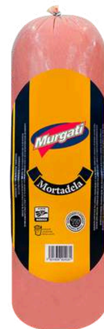
Mortadela. Presentación: Misil. Clave: MG4100.