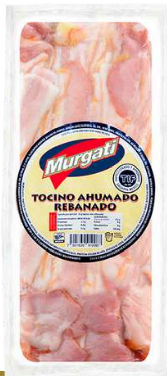
Tocino ahumado rebanado. Presentación: Paquete 1.0 kg. Clave: MG5101.