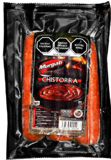
Chistorra. Presentación: Paquete 300 gr (6 piezas). Clave: MG3111.