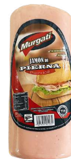
Jamón de pierna. Presentación: Rombo. Clave: MG1502.