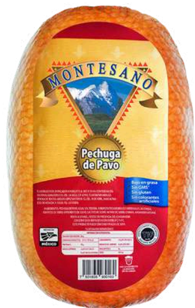
Pechuga de pavo. Presentación: Paquete (1 pieza). Clave: MT1307.