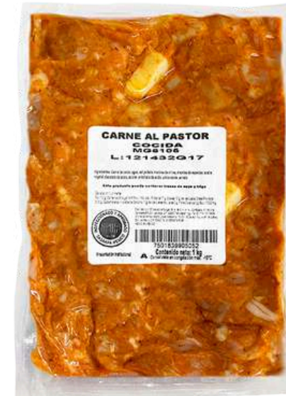
Carne al pastor. Presentación: Paquete 1 kg. Clave: MG6105.