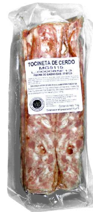
Tocineta ahumada. Presentación: Paquete 1.0 kg redondo. Clave: MG5115