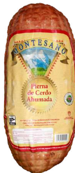
Pierna de cerdo ahumada. Presentación: Bolsa (1 pieza). Clave: MT5102.*