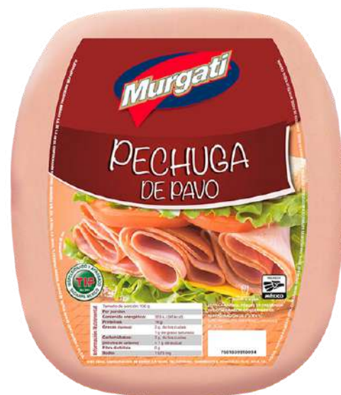
Pechuga de pavo. Presentación: Mandolina. Clave: MG1308.