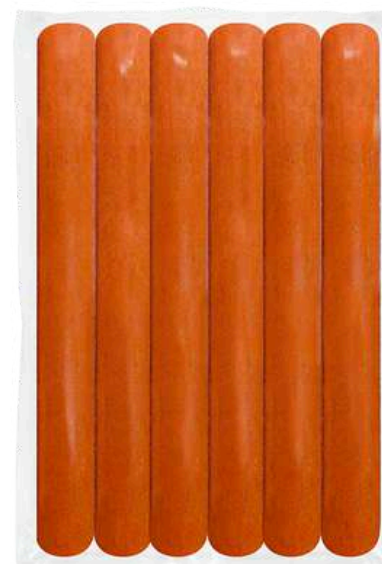
Salchicha de pavo ahumada extra 23 cm. Presentación: Paquete (10 piezas). Clave: DL4109.