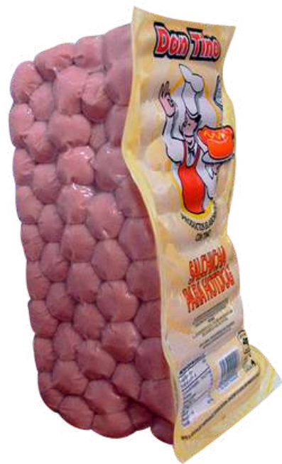
Salchicha de pavo Hot Dog. Presentación: Paquete 2.3 kg (granel). Clave: DT4109.